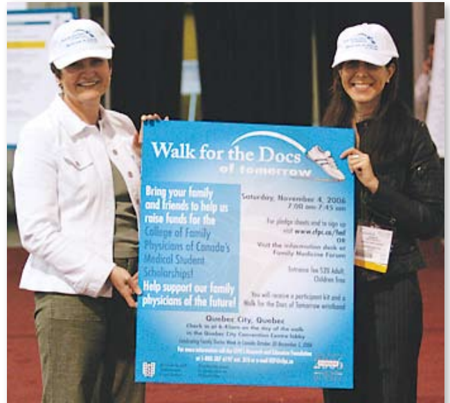
Des bénévoles font la promotion de la Marche de la FRE à Primary Care Today

Amenez un ami et participez à la deuxième Marche pour les médecins de demain, le samedi 4 novembre 2006 dans la ville de Québec (pendant le Forum en médecine familiale). Pour en savoir plus sur cette activité de financement, rendez-vous à www.cfpc.ca .